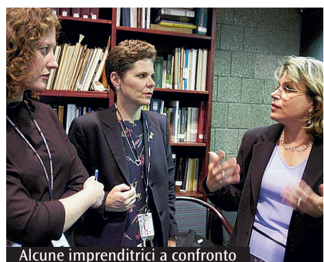
Alcune imprenditrici a confronto